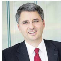
Severin Schwan, Österreicher, Konzernchef von Roche