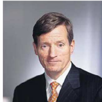
Brady Dougan, Amerikaner, Konzernchef von Credit Suisse