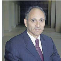
Joe Jimenez, Amerikaner, Konzernchef von Novartis