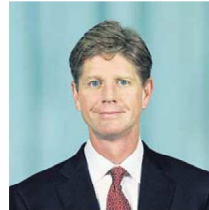
Joe Hogan, Amerikaner, Konzernchef ABB