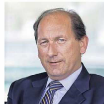
Paul Bulcke, Belgier, Konzernchef von Nestlé